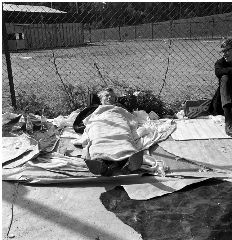
Over: Ungdom som står og ligger i kø for å kjøpe billetter til Rolling Stones-konserten på Sjølyst i 1965.