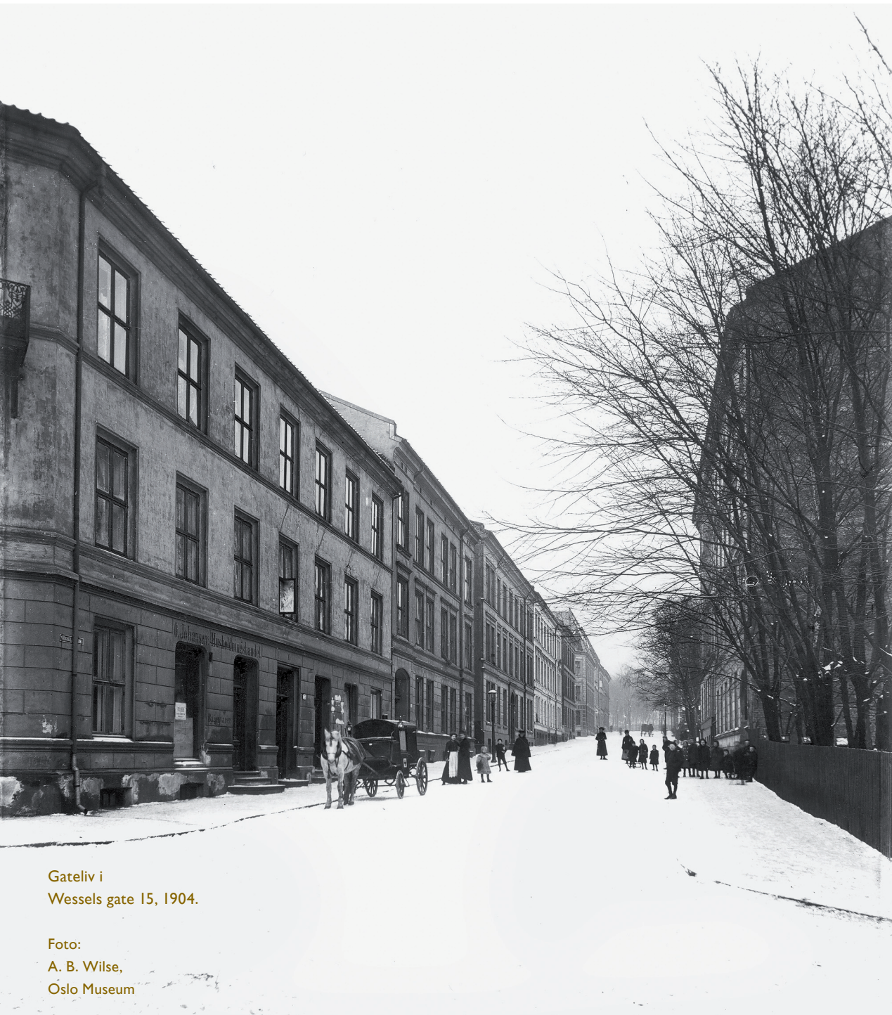
Gateliv i Wessels gate 15, 1904.