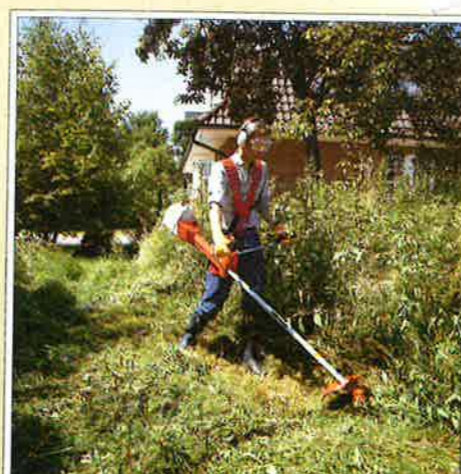
På gården, i skogen og i haven er DOLMAR ryddesag svaret når det gjelder å fjerne høyt gress, brennesle og annet uønsket vegetasjon.