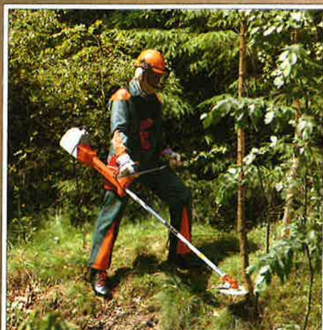
Skogsarbeideren bruker DOLMAR ryddesag til rydding og tynning.

Motorstøy er effektivt dempet med den inneklede motor og lydemper under motordekslet. Et spesielt innsugningssystem med resonansekammer reduserer innsugningsstøyen. Den effektive støy-dempingen betyr at MS-3300 og MS-4000 ryddesager er svært stillegående.