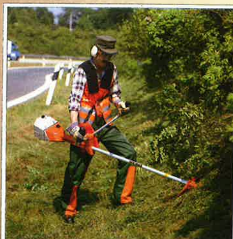
Fordelene med DOLMAR ryddesager er anvendeligheten i vanskelig terreng som grøftkanter og hellinger.